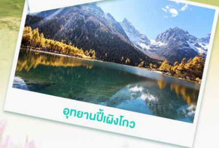
อุทยานปี้เฟิงโกว