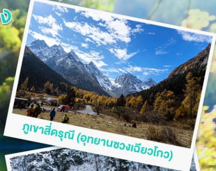
ภูเขาสีดรุณี (อุทยานแห่งชาติหวงโกว)